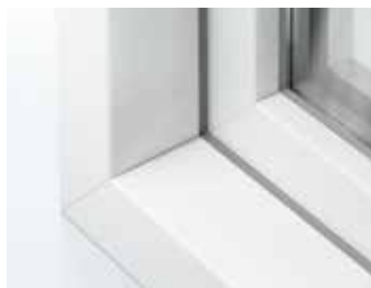
Schüco LivIng Variant in verstek met een omlopende kader contour van 15°

Het kunststof systeem Schüco LivIng Variant is een innovatief 6-kamersysteem. Het systeem staat garant voor onovertroffen thermische isolatie en smalle aanzichtbreedtes. Bovendien zorgt de verhoogde constructie diepte voor meer veiligheid, zodat het hangen sluitwerk ver naar binnen ligt en inbrekers weinig houvast hebben om toe te slaan.